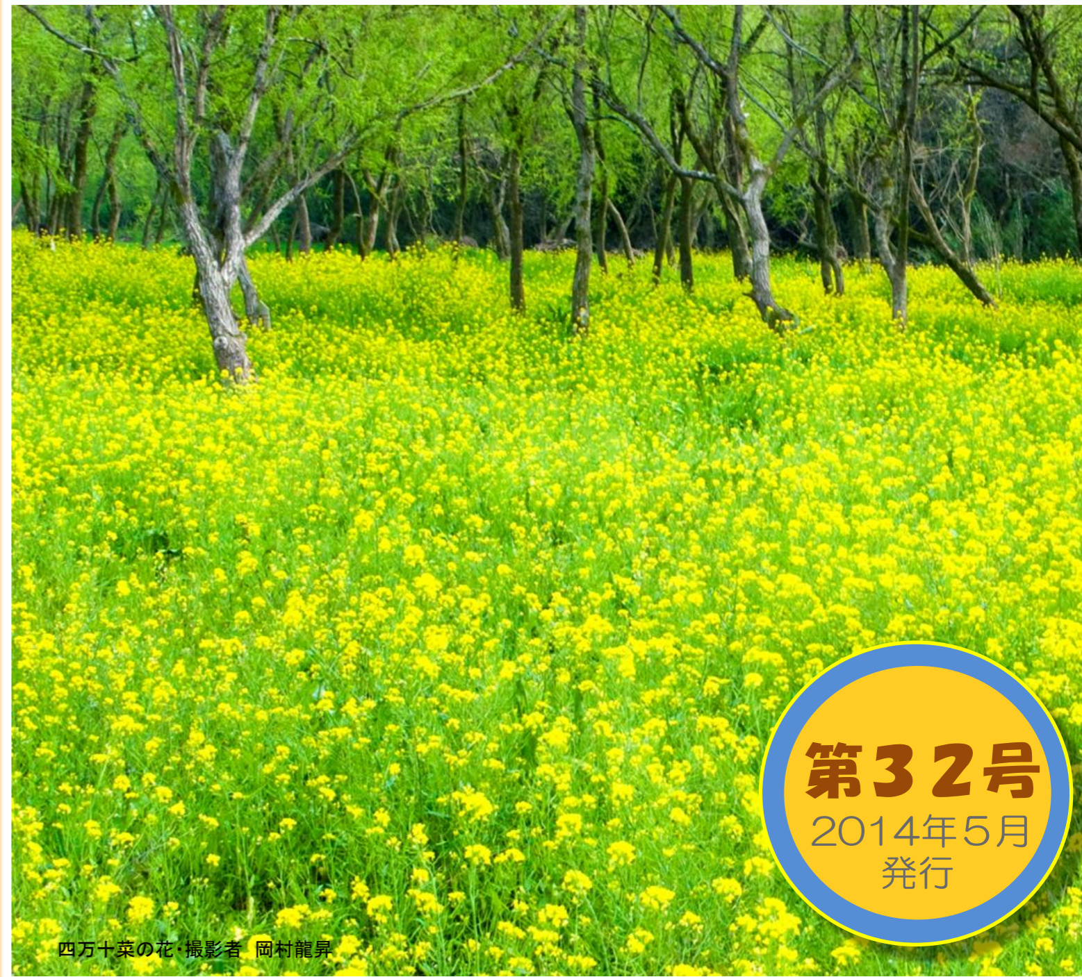
四万十菜の花